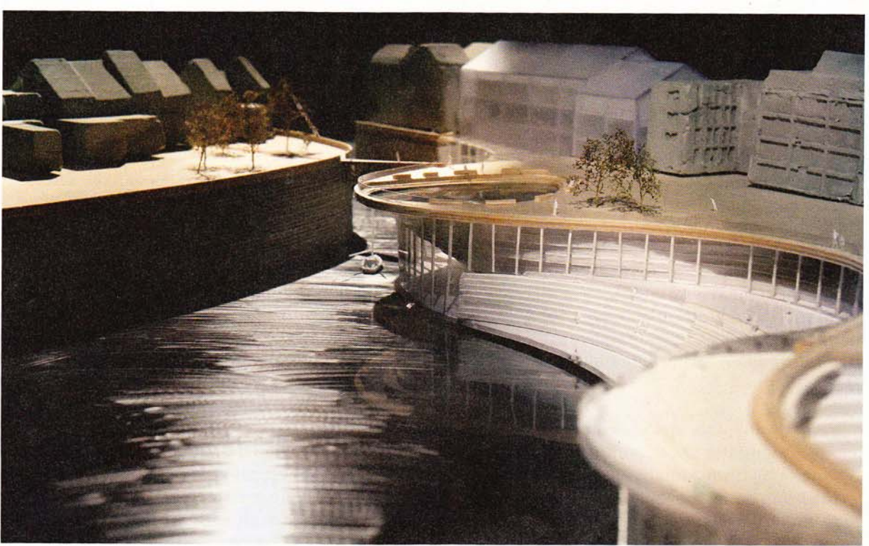
Het water vindt meanderend zijn weg